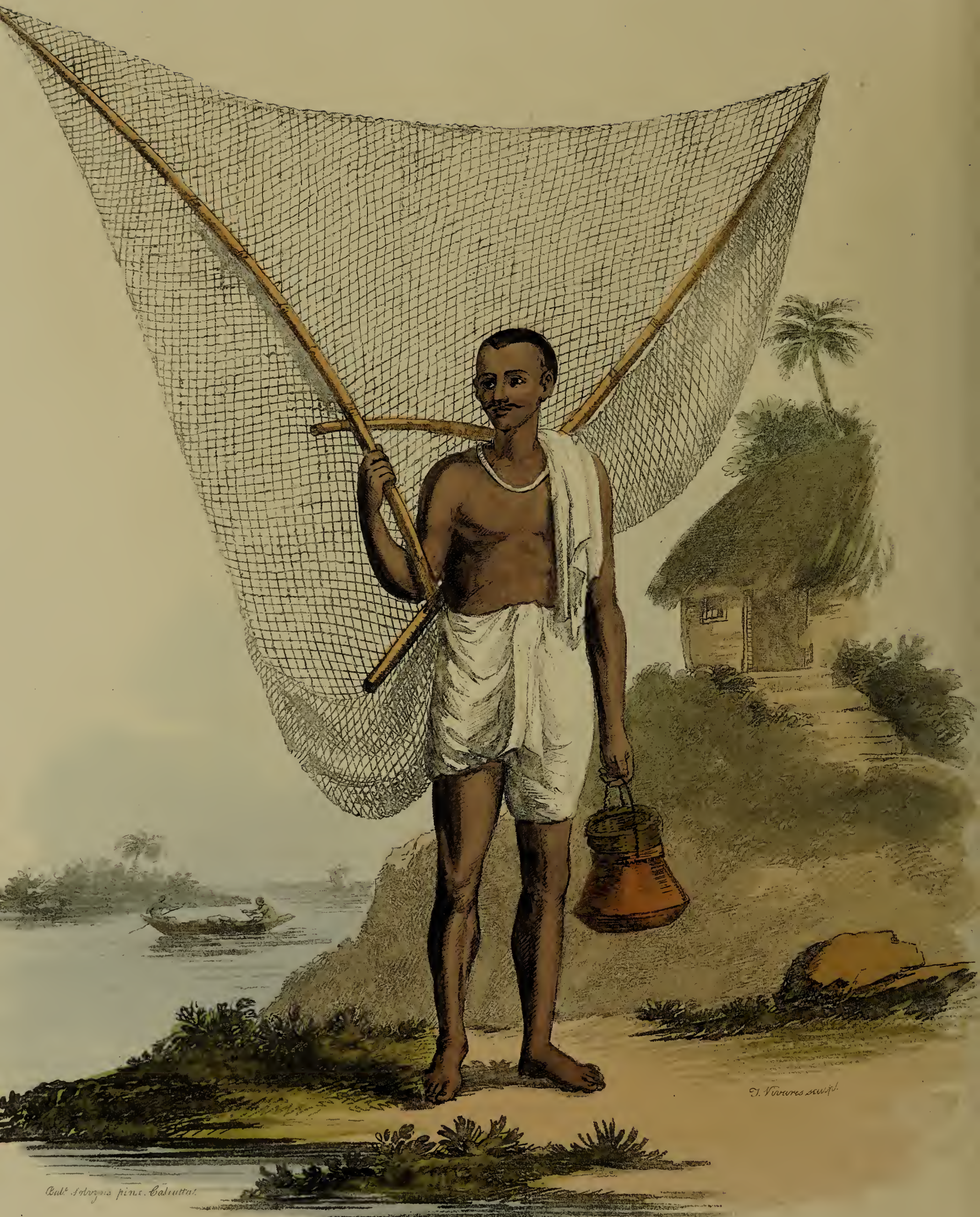
Cal. Solorgia pinc. Calcutta.